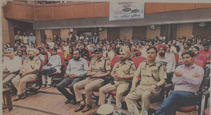
बठिंडा के सरकारी राजिंदरा कालेज में नशे के खिलाफ आयोजित सैमिनार में मौजूद अधिकारी